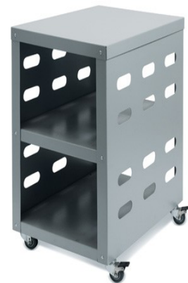
Untertisch mit Rollen – bequemes und mobiles Arbeiten