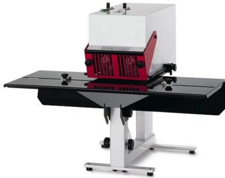
Modell HM6/2 mit Doppelheftkopf (wie abgebildet);