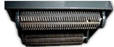
Nahaufnahme der integrierten Aufrauhvorrichtung PGO - öffnet die Papierfaser geräuschlos und staubfrei