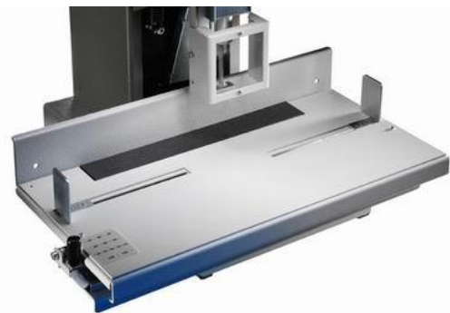
Die Abbildung zeigt den selbstzentrierenden Anschlag

VOGT Papiertechnik Weilemer Weg 13 71155 Altdorf