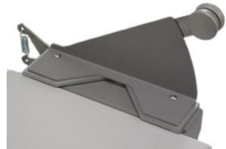
Abbildung: die optionale Eckenschneidevorrichtung, die seitlich an der Buchbindeplatte befestigt wird.