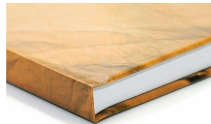
Abbildung: ein Hard-Cover Exemplar, mit der Elite XT und Casematic XT hergestellt.

VOGT Papiertechnik Weilemer Weg 13 71155 Altdorf