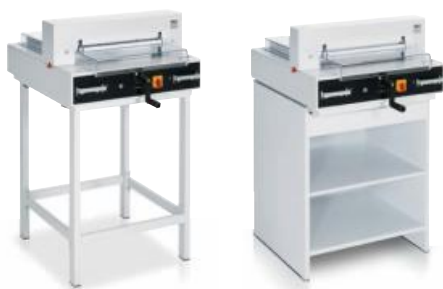
Untergestell optional Unterschrank optional