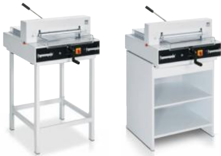
Untergestell optional Unterschrank optional